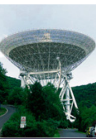
A Mit dem Radioteleskop Effelsberg (Bad Münstereifel) wurde der Pulsar im Zentrum unserer Milchstraße entdeckt

Die Forscher wollen zukünftig mit dem Pulsar u.a. die Umgebung des Schwarzen Lochs messen. bs