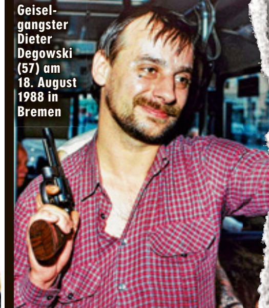
Geiseltangster Dieter Degowski (57) am 18. August 1988 in Bremen